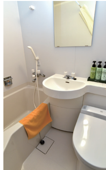
Unit bath / ユニットバス