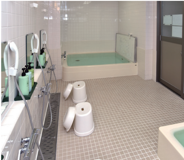
Large public bath / 大浴場