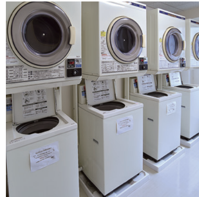
Coin laundry / コインランドリー