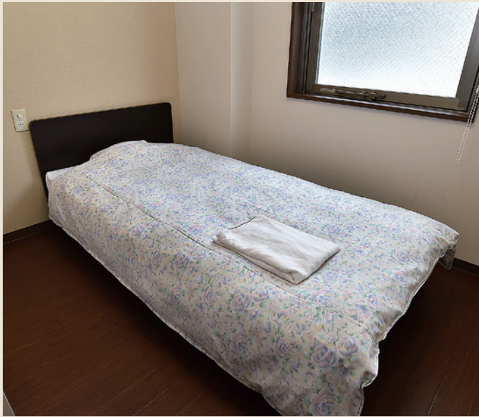
Guest room / シングル